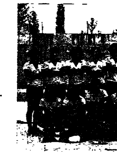
الاخاء الناصرة في جارة مع مجدل هعيق سجلت تسع اصابات . .